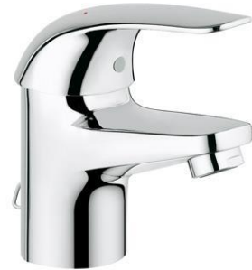
Grohe Euroco met ketting chroom