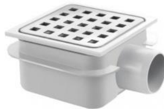
doucheput 15x15 cm