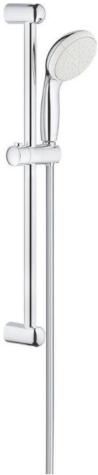
Grohe New Tempesta glijstangset