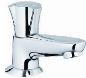
F Grohe Costa-L