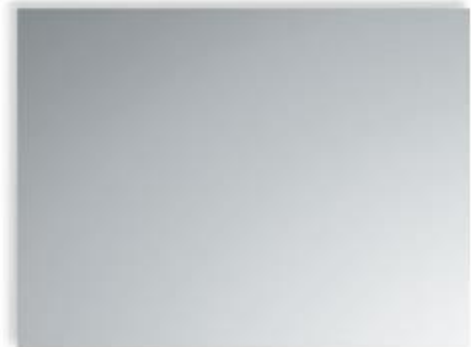
Spiegel rechthoekig 40 x 60 cm met spiegelklemmen