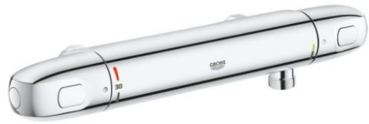
F Grohe Grohtherm-1000 New thermostatische douchekraan met koppelingen chroom