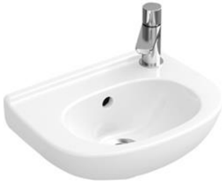
Villeroy & Boch O.Novo Fontein 36 x 27,5 cm wit (excl. afgebeelde kraan)