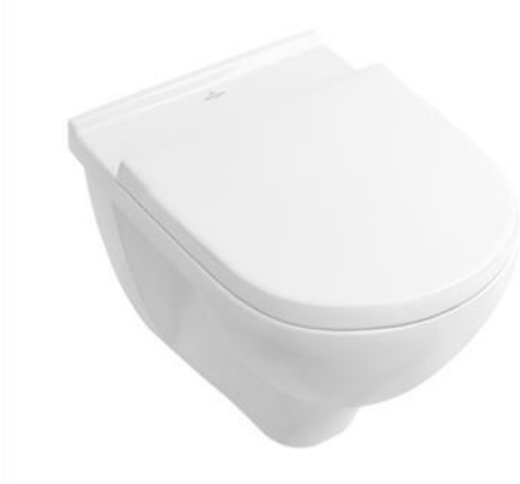
Villeroy & Boch O.Novo wandcloset en zitting met deksel wit softclose en quickrelease