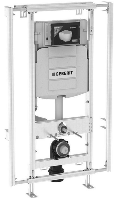
Geberit Giseasy inbouwreservoir