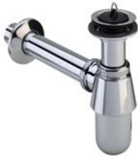
Viega plugbekersifon met muurbuis chrome