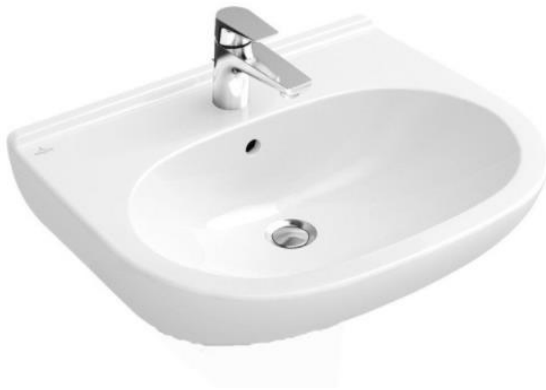
Villeroy & Boch O.Novo wastafel 60 x 49 cm keramiek wit (excl. afgebeelde kraan en plug)